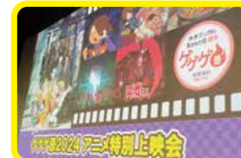
アニメ特別上映会