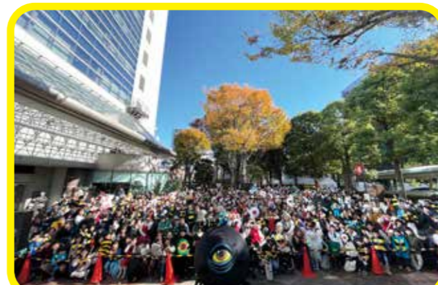
「調布市ブリガドーン計画」