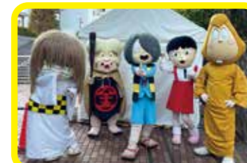
ゲゲゲ横丁・ゲゲゲの森

主催：調布市 共催：調布市観光協会 協力：水木プロダクション・東映アニメーション ほか