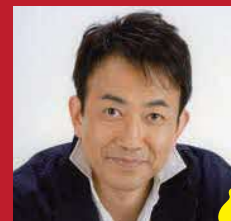
声優 関 俊彦さん