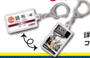
限定駅名キーホルダー(イメージ)