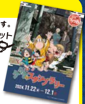
スタンプラリー-台紙 (イメージ)