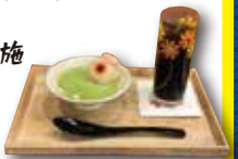
(例)「甘味 an&」限定メニュー