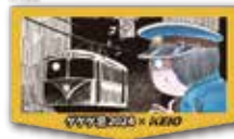
記念ヘッドマーク(イメージ)