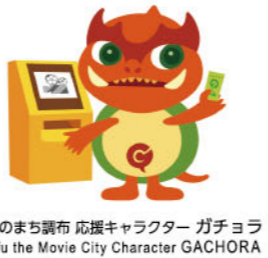
映画のまち調布 応援キャラクター ガチョウ Chofu the Movie City Character GACHORA

イオンシネマ シアタス調布 AEON CINEMA THEATUS CHOFU 「映画のまち調布」のランドマークである大型シネマコンプレックス。11スクリーン1672席(うち車椅子20席)の座席を誇る。 A huge cinema complex that serves as a landmark of "Chofu the Movie City" with 11 screens and 1,672 seats (including 20 with wheelchair access).