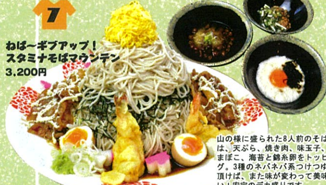
おぼ〜ギブアップ！スタミナそばマウンテン 3,200円

山の様に盛りださる8人前のそばには、天ぷら、焼き肉、味玉子、かまぼこ、海苔と鰹糸卵をトッピング。3種のネバネバ系つけついで頂けば、また味がかわって美味しい！安定のデカ盛りです。