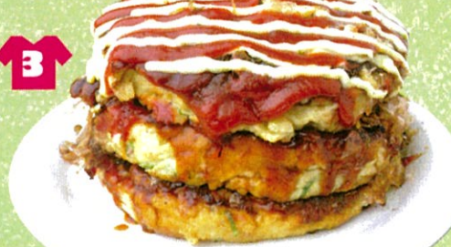
チェリーブロッサム3段盛り 2,000円

どんと3段、お好み焼きのエアースロック！ 厚切りの豚肉が3枚乗ったお好み焼きがどんと3段重なっています。てっぺんには日本代表ユニフォームをイメージした赤いケチャップと白いマヨネーズのストライプが！干しエビのダシが効いたヤマトイモ入りのふわふわ生地はどんと食べられちゃう美味しさです。